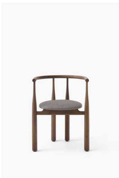
Bukowski Stol Valnød