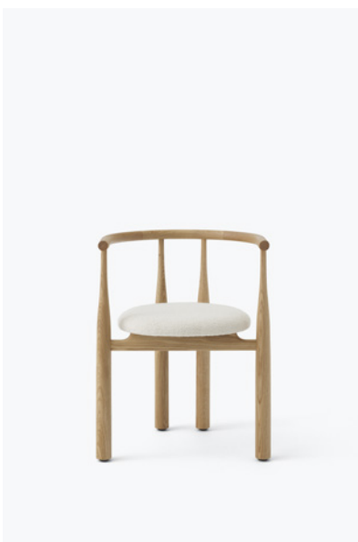
Bukowski Stol Sort